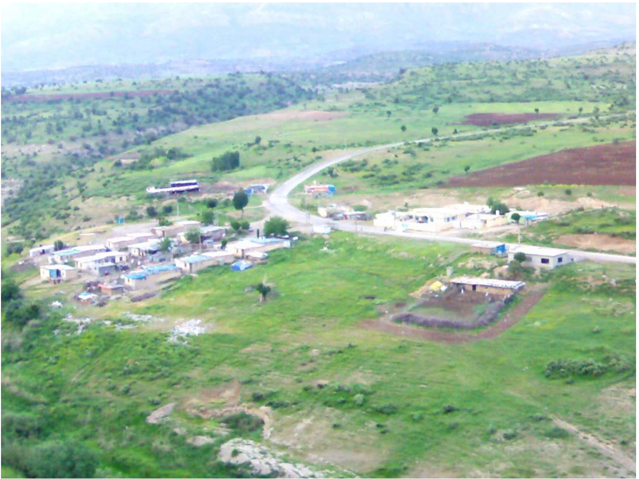
گوندی زفنگا دوسکيا