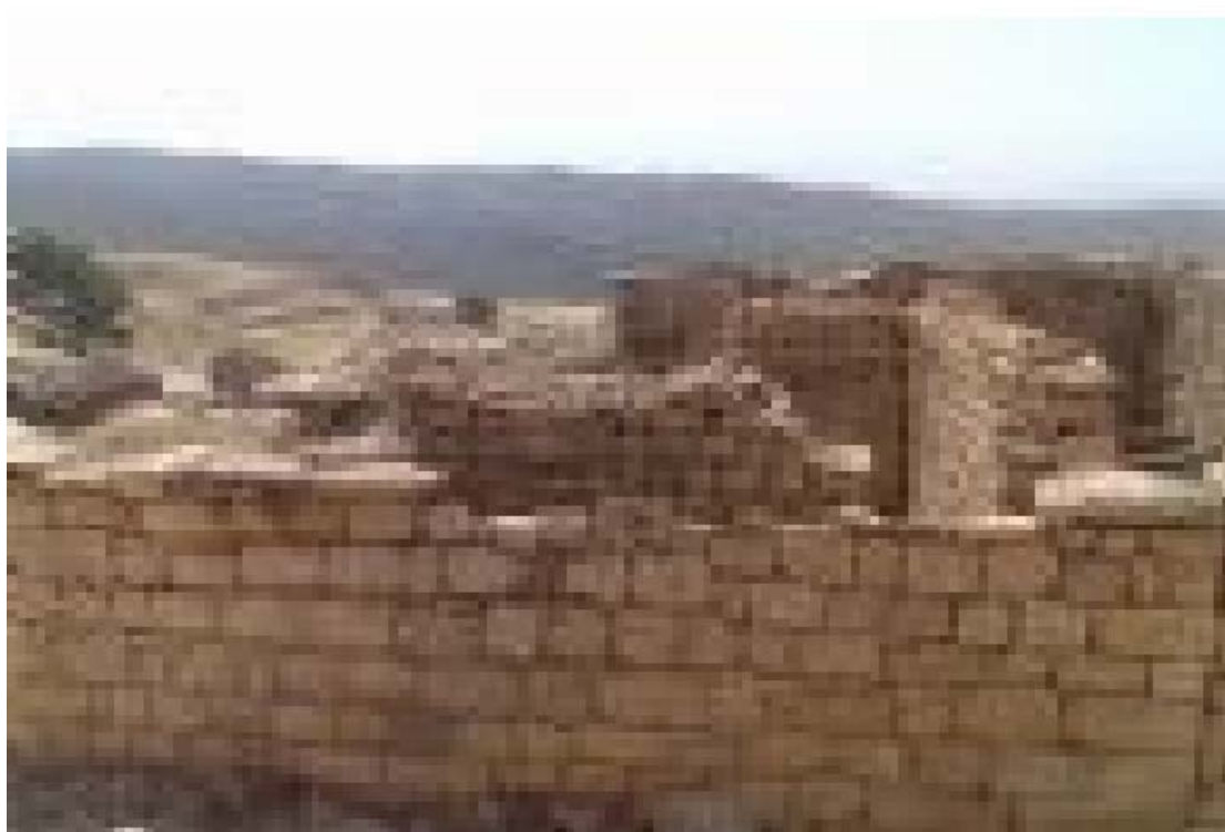
وېنهيك ژگوندى زفنگا حاجى عه ليا (پشتى هاتيه خرابكرن)