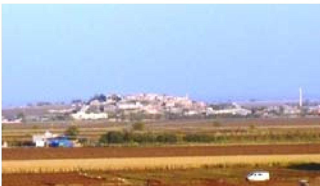
گوندی کہرتہ فینی (قہرتہ وینی) (Duruca)