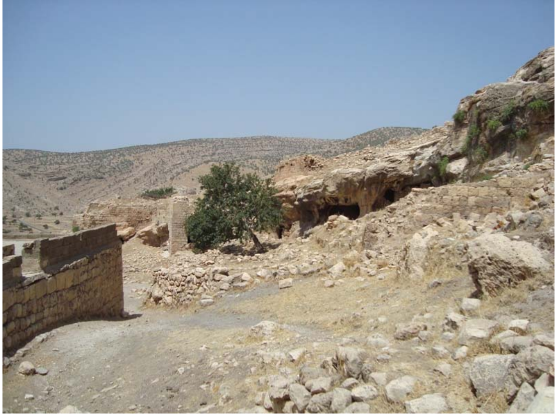
وينهيك ژ گوندي زفتگا حاجي عهليا (پشتي هاتيه خرابكرن)