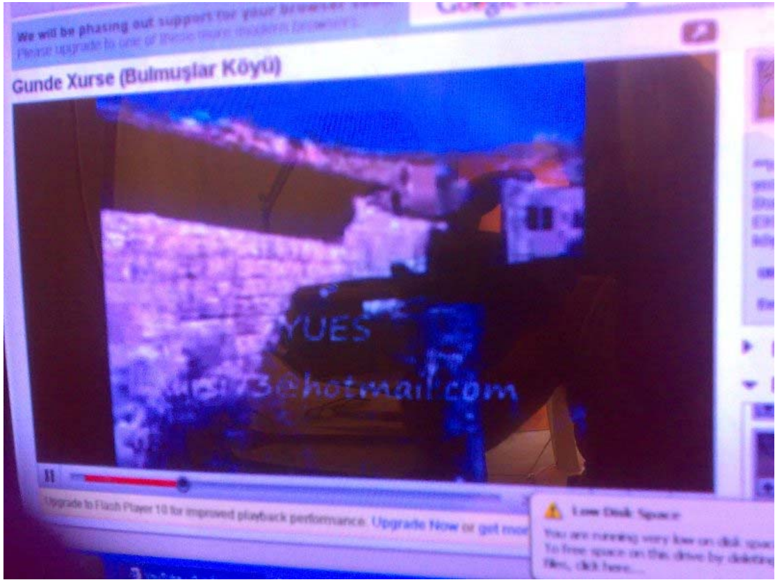
وېنډهك ژگوندى خورسى Bulmuslar